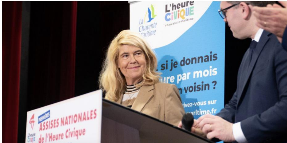
Dominique Faure, la ministre déléguée aux collectivités territoriales et à la ruralité lance le 29 février L'heure civique

par Antonin Bojkovski · 2 mars 2024 à 12h14