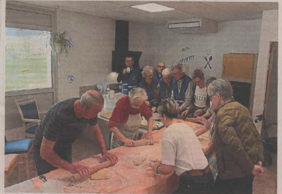
Des résidents d'un Ehpad et d'un foyer pour adultes handicapés cuisinent ensemble des bottereaux, aidés par des habitants de Treize-Septiers (Vendée) revêtus de leur chasuble de l'heure civique. Florence Pignoux

Les premiers bottereaux viennent de sortir du four. Ce matin-là, des résidents d'un foyer pour adultes handicapés et d'une maison de retraite attenante cuisinent ensemble ces petits beignets vendéens pour les offrir l'après-midi même à ceux qui fêtent leur anniversaire. Ces habitants de Treize-Septiers (Vendée) ont revêtu pour l'occasion leur chasuble bleue de «l'heure civique», déployée depuis un an par le département dans les communes volontaires. L'idée est née dans la tête d'Atanase Périfan, déjà initiateur de la Dîner des voisins et