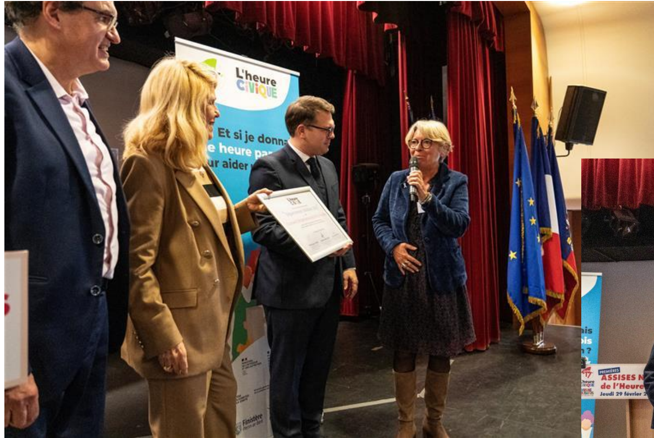
Remise du label « Ville Solidaire » à des maires